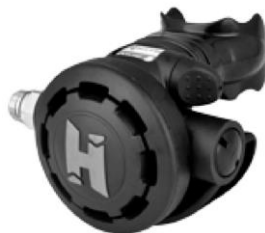
Fig.6 Secondo stadio Aura