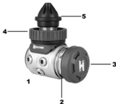
Figura 4. Primo Stadio a diaframma

La presenza di umidità nella bombola può causare la corrosione delle stesse e potrebbe causare il congelamento e il successivo malfunzionamento dell'erogatore durante le immersioni effettuate a temperature dell'acqua fredda (inferiori a 10°C (50°F)). Le bombole devono essere riempite solo con aria atmosferica compressa, secondo la norma EN12021. Gli altri gas devono essere conformi alle normative vigenti. Ad esempio, l'uso di NITROX in Europa è regolato dal EN13949 e dalla EN144-3. Le bombole devono essere trasportate secondo le norme locali previste per il trasporto di merci pericolose. L'uso delle bombole è soggetto alle leggi che regolano l'uso di gas e aria compressa.