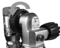
Fig.2 Inserita il cappuccio protettivo per l'attacco DIN