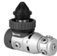
Fig.3 Cappuccio protettivo per l'attacco DIN inserito

Chiudere la valvola della bombola e scaricare il sistema di regolazione premendo il comando di spurgo di ogni Secondo Stadio. Dopo che il sistema è stato depressurizzato, scollegare il Primo Stadio dalla rubinetteria. Tutti gli ingressi del Primo Stadio devono essere chiusi con i cappucci protettivi in dotazione per evitare l'ingresso di detriti, sporcizia o umidità (vedere figura 3).