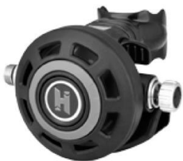
Fig.5 Secondo stadio Halo

L'Air Control Vane (ACV) dirige il flusso d'aria ad alta velocità su una speciale paletta che crea un'area di bassa pressione all'interno della scocca del Secondo Stadio. Questa depressione tira il diaframma all'interno della scocca, mantenere la pressione sulla leva della valvola e mantenere la valvola aperta senza richiedere ulteriore sforzo da parte del sub. In alcuni Secondo Stadi Halcyon, l'ACV può essere regolato durante l'immersione cambiando la posizione della paletta attraverso la manopola posizionata all'esterno del Secondo Stadio. Nel Secondo Stadio Halcyon non dotato di una manopola esterna, la posizione ACV è preimpostata per fornire alte prestazioni evitando l'auto-erogazione. Questa levetta può essere regolata da un qualsiasi servizio autorizzato Halcyon.