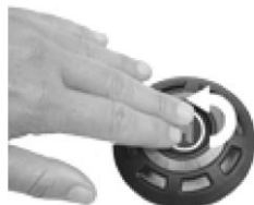
Fig.7 Protezione Anti-set